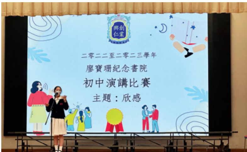
各科教師把「欣·感」文化滲入教學中，以「欣賞」和「感恩」為主題舉辦活動，例如中文科舉辦「欣·感」演講比賽。