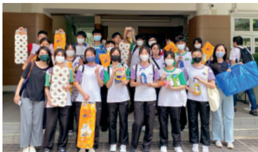
學生透過參與義工活動，將關愛文化帶進社區，以促進社會和諧共融。

所屬區份：荃灣區 辦學團體：廖寶珊教育基金有限公司 學校類別：資助 新界荃灣蕙荃路22-66號 2499 6711 info@lpsmc.edu.hk www.lpsmc.edu.hk