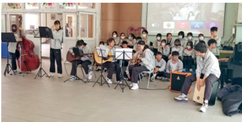
「午間舞台」由學生一同策劃及演出，他們在籌劃過程中加深對彼此的了解，學懂互相包容。