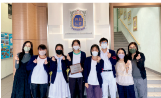
「欣·感」文化推行了近三年，師生比以前更投入校園生活，學校更連續兩年奪得「樂繫校園獎勵計劃」榮譽大獎。