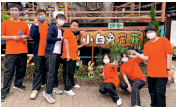
「朋輩輔導計劃」中，每位高中朋輩輔導員與一至兩位中一生配對，全年策劃多個活動，例如參觀農場，建立深厚的連繫和支援網絡。